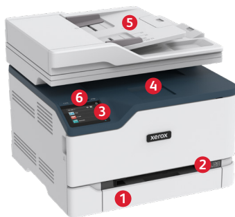
Barevná multifunkční tiskárna Xerox® C235